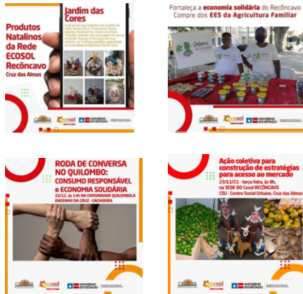
Peças de comunicação criadas e veiculadas

As peças foram elaboradas para fortalecer a comercialização bem como a Rede Ecosol, além, claro, divulgar os empreendimentos