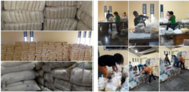
ORGANIZAÇÃO DE CESTAS BÁSICAS: CAMPANHA TEM GENTE COM FOME NOVEMBRO DE 2021

Diante de tantos obstáculos, os empreendimentos não deixaram de comercializar seus produtos. Através de ações parceiras do Cesol Recôncavo foi possível inserir produtos em espaços apoiados por outros Cesols, bem como escoar a produção in natura dos empreendimentos da agricultura familiar através das campanhas de cestas básicas articulada pelo MPA- Movimento dos Pequenos Agricultores em parceria com a CEDITER e o Delivery em Salvador, tais como ORGANIZAÇÃO DE CESTAS BÁSICAS: CAMPANHA TEM GENTE COM FOME NOVEMBRO DE 2021; CAMPANHA FUNDAÇÃO BANCO DO BRASIL / NOVEMBRO-2021