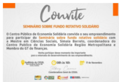
Convite do Seminário Fundo Rotativo Solidário

Essas peças de comunicação e propaganda desenvolvidas e aplicadas foram divulgadas em site e redes sociais (facebook, instagram):