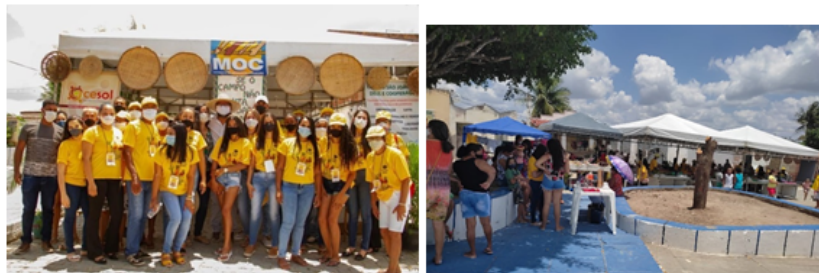
Feira da Agricultura Familiar em Nova Esperança-Ichu-BA.