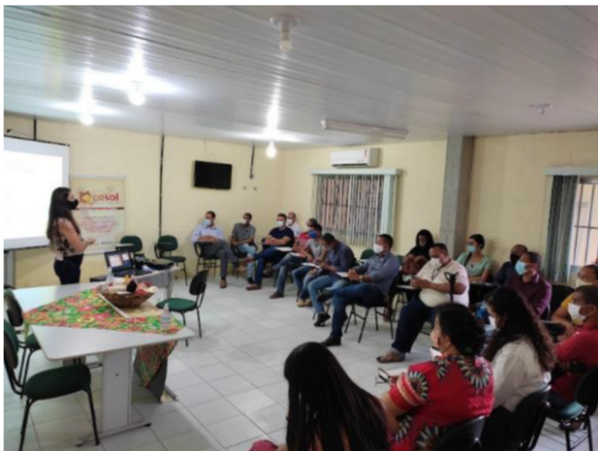
FOMENTO DE POLITICA PUBLICA MUNICIPAL EM ECONOMIA SOLIDARIA

As comprovações foram anexadas ao Relatório de Prestação de Contas.