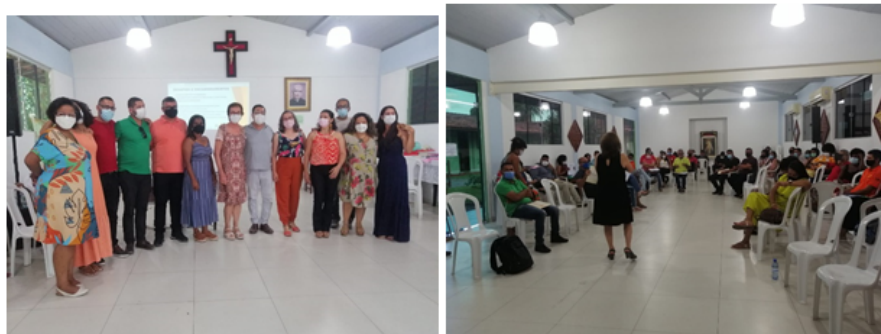
V Encontro Técnico dos Centros Públicos de Economia Solidária na Bahia no município de Feira de Santana.