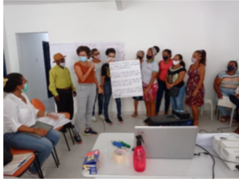
Representantes EES apresentando o que assimilaram sobre Fundos Rotativos